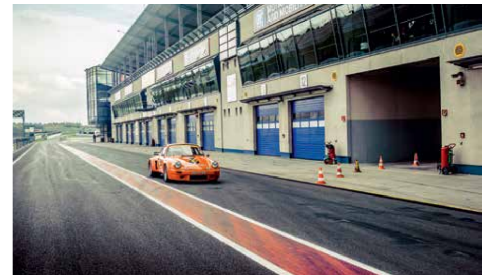
Auslauf gewähren: Nach vier Jahrzehnten so vertraut wie in den Siebzigerjahren.

„Ich war sofort wieder Teil von dem Auto.“